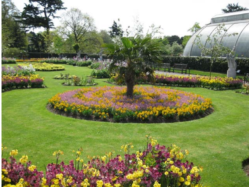
Bepantningen foran The Palm House