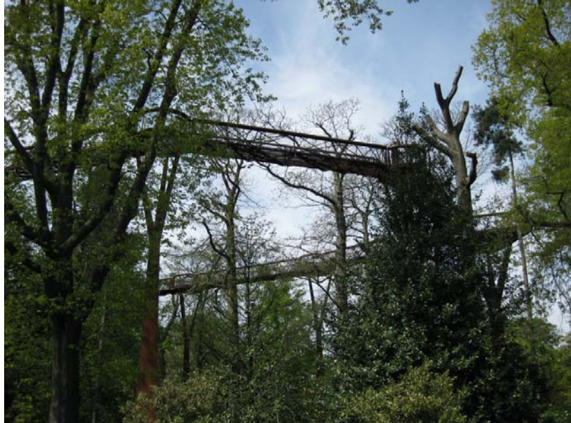
Gangveien sett fra bakken

En 200 meter lang gangvei formet som en stor sirkel, støttet av stålbejler 18 meter høye og åpnet i mai 2008. Gulvet og sidene er laget av metallgitter, slik at man får full utsikt. Gangveien er lagt nær trekrone så blomster og blader kan sees på nært hold.