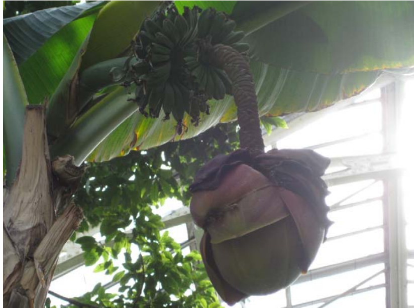
Musa basjoo, Prydbanan