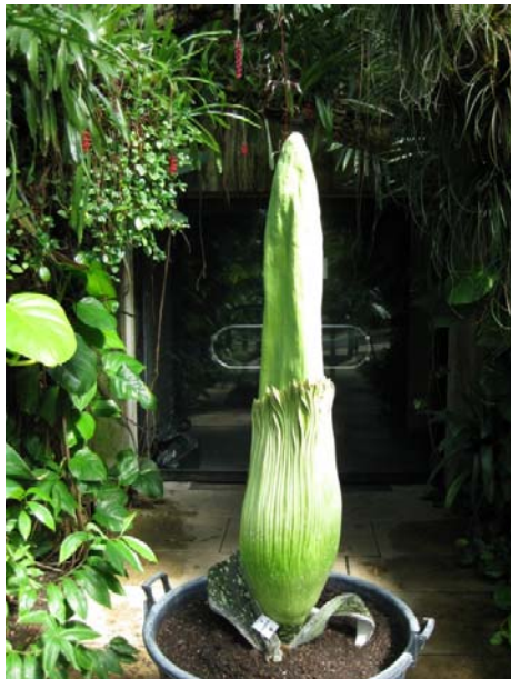
Amorphophallus titanum , også kalt titan arum eller Likblomst. Akkurat denne planten blomstret helga etter mitt besøk.

Et glasshus med 10 klimasoner, åpnet i 1987 av Prinsesse Diana (men oppkalt etter Prinsesse Augusta som grunnla hagen). De to største sonene er tørr tropisk og våt tropisk, de åtte resterende er mikro-klimasoner som er laget spesielt for visse planter.