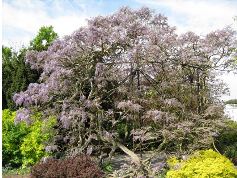
Wisteria floribunda (Japanblåregn)