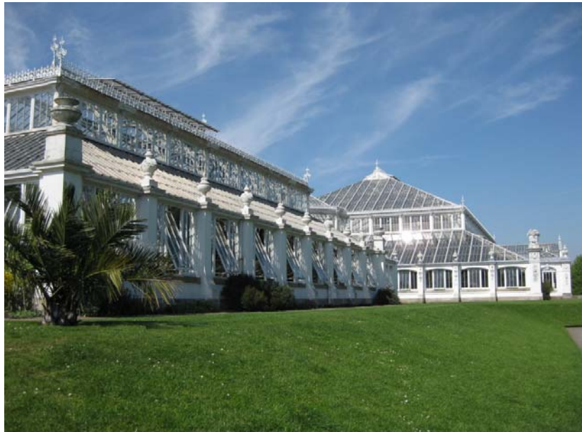
Del av det Tempererte huset