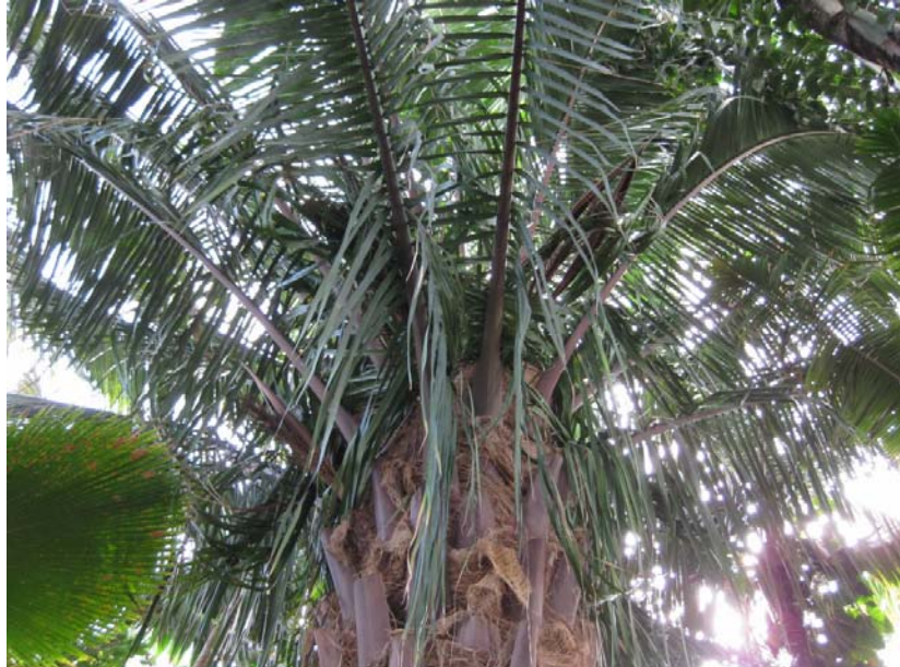
Attalea butyracea, Yagua-palme eller Amerikansk oljepalme, den største palmen i Palmehuset

Den mest kjente bygningen i Kew, stod ferdig i 1848 og er laget helt i glass og jern. Utstillingen er delt opp etter hvilke geografiske områder plantene kommer fra; Afrika, Amerika og Asia/Australasia/Stillehavet. I den midtre delen er de aller høyeste plantene samlet.