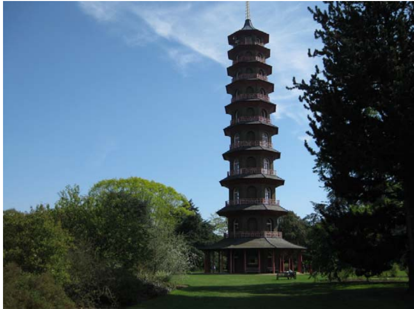
Den japanske pagoden, ferdig i 1762 og nesten 50 meter høy. Den er stengt for publikum.